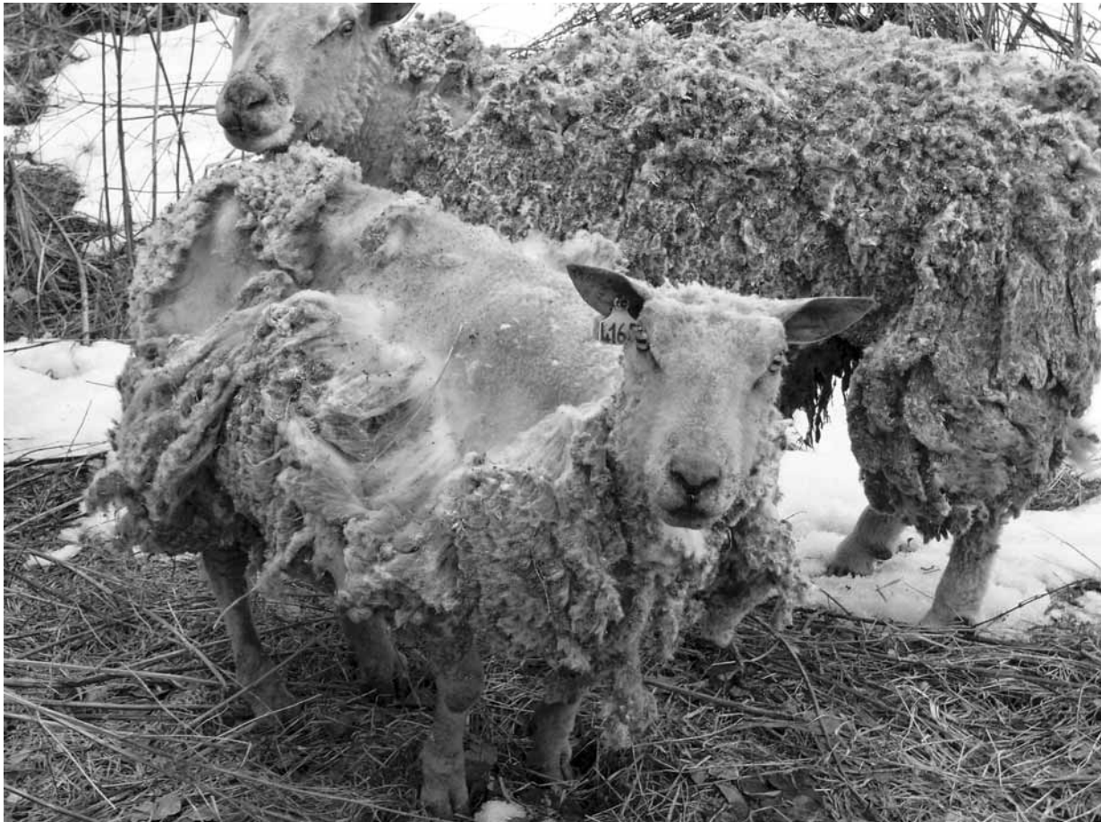
Ovce v Tasově: Zatím bohužel nevyřešený případ.