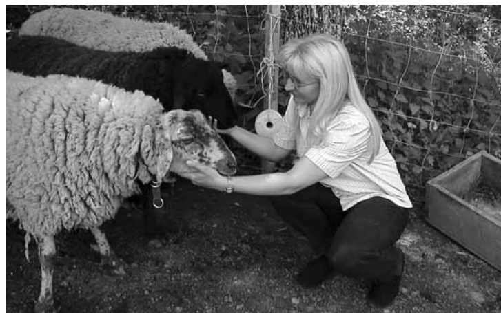
Zachráněné ovce v útulku Animal Spirit u Vídně.