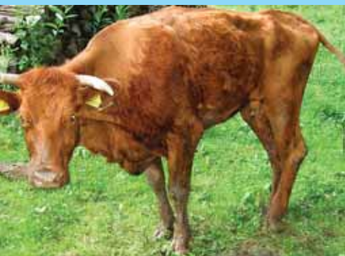
Vyhozená kráva - str. 4

Co nás čeká na jatkách? Fotoreportáž na str. 6 - 7