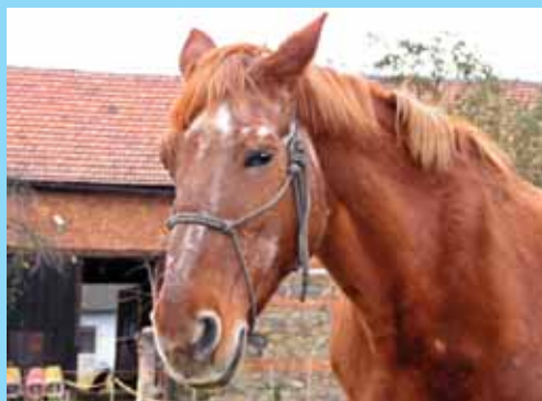
Kačenka děkuje za pomoc - str. 8