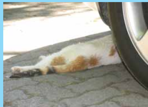
Pomozte kočkám kastracemi - str. 9

další témata: vegetariánská výživa, záchráněná zvířata, veganství & očkování, ovčí vlna